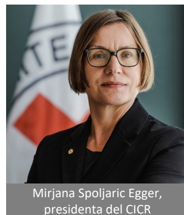
Mirjana Spoljaric Egger, presidenta del CICR

1) “Gaza: La Cruz Roja abre un nuevo hospital de campaña con capacidad para 60 camas” – Comunicado de prensa [en línea] / Comité Internacional de la Cruz Roja (CICR), 14 de mayo de 2024.