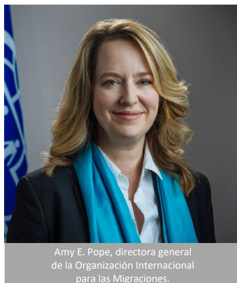
Amy E. Pope, directora general de la Organización Internacional para las Migraciones.

Desde el 1.º de octubre de 2023, la directora general de la OIM es Amy E. Pope. En los 73 años de historia del organismo, Pope es la primera mujer en ocupar el cargo. Es también la novena directora general estadounidense, sobre un total de once directores generales desde 1951.