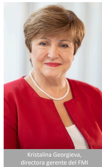
Kristalina Georgieva, directora gerente del FMI

Para más información, véase: https://www.imf.org/en/About .