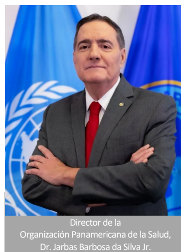
Director de la Organización Panamericana de la Salud, Dr. Jarbas Barbosa da Silva Jr.

El director de la Organización Panamericana de la Salud es el Dr. Jarbas Barbosa da Silva Jr.