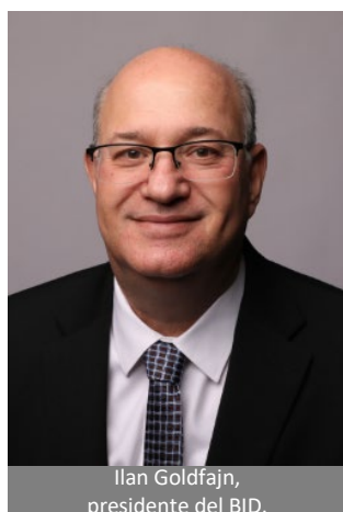
Ilan Goldfajn, presidente del BID.

La máxima autoridad del BID es la Asamblea de Gobernadores . Cada país miembro designa a un gobernador, cuyo poder de votación es directamente proporcional al capital ordinario (CO) que el país suscribe a la institución. Los gobernadores son generalmente ministros de Hacienda, presidentes de bancos centrales o altos funcionarios públicos. Celebra una reunión anual en marzo o abril para analizar las operaciones y actividades del Banco y adoptar decisiones que se registran como Resoluciones Aprobadas . Asimismo, realizan reuniones extraordinarias para discutir asuntos urgentes o claves para el Banco.