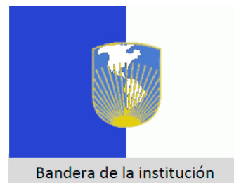
Bandera de la institución

Todo país interesado en ingresar al BID como miembro regional debe ser miembro de la Organización de Estados Americanos (OEA). Los países que desean ser admitidos como miembros no regionales, deben ser miembros del Fondo Monetario Internacional (FMI). En ambos casos, los países interesados deben cumplir con el requisito básico de suscribir acciones de capital ordinario y contribuir al fondo para operaciones especiales.