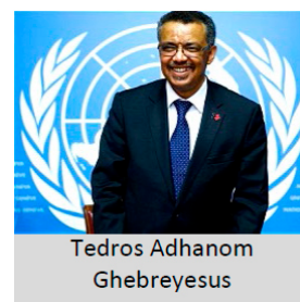
Tedros Adhanom Ghebreyesus

Desde mayo de 2017, el director general es el Dr. Tedros Adhanom Ghebreyesus.