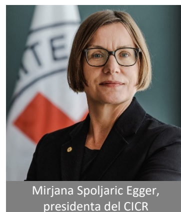
Mirjana Spoljaric Egger, presidenta del CICR

1) “República Democrática del Congo: los civiles están en la línea de fuego, mientras el uso de armas pesadas marca una nueva fase del conflicto armado en el Este” – Comunicado de prensa [en línea] / Comité Internacional de la Cruz Roja (CICR), 6 de marzo de 2024.