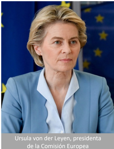
Ursula von der Leyen, presidenta de la Comisión Europea

Cada una de las principales instituciones de la UE tiene su presidente. Roberta Metsola preside el Parlamento Europeo y Ursula von der Leyen preside la Comisión. La presidencia del Consejo Europeo no es un cargo personal; es desempeñada con carácter rotatorio por los países miembros. Cada turno está preestablecido y dura seis meses.