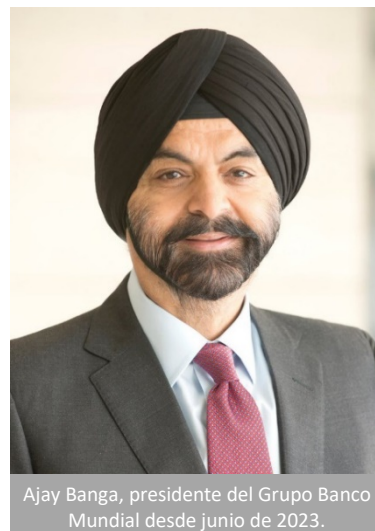
Ajay Banga, presidente del Grupo Banco Mundial desde junio de 2023.

David R. Malpass es el presidente del Grupo Banco Mundial; asumió su cargo el 9 de abril de 2019. Para más información véase: https://www.bancomundial.org/ .