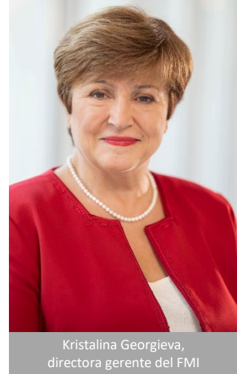
Kristalina Georgieva, directora gerente del FMI

Para más información, véase: https://www.imf.org/en/About .