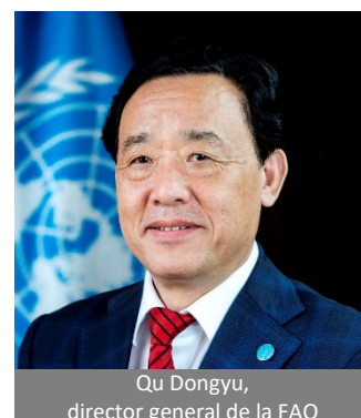
Qu Dongyu, director general de la FAO

Para más información véase: http://www.fao.org/about/es/ .