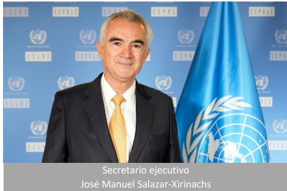
Secretario ejecutivo José Manuel Salazar-Xirinachs

Breve historia. La Comisión Económica para América Latina (CEPAL) fue establecida por la resolución 106 (VI) del Consejo Económico y Social (ONU), del 25 de febrero de 1948, y comenzó a funcionar ese mismo año. Es una de las cinco comisiones regionales de las Naciones Unidas y su sede está en Santiago de Chile.