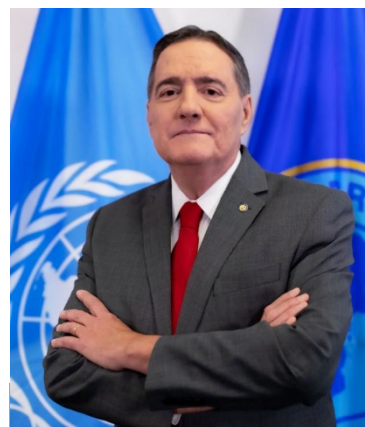
Director de la Organización Panamericana de la Salud, Dr. Jarbas Barbosa da Silva Jr.

El director de la Organización Panamericana de la Salud es el Dr. Jarbas Barbosa da Silva Jr.