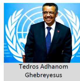
Tedros Adhanom Ghebreyesus

Desde mayo de 2017, el director general es el Dr. Tedros Adhanom Ghebreyesus.