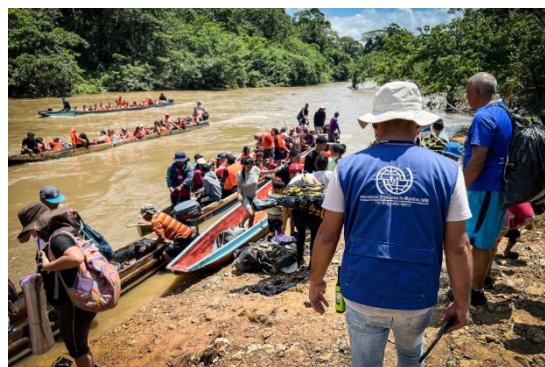
Personas migrantes desembarcan en el río Chucunaque tras haber cruzado la selva de Darién entre Colombia y Panamá.

La OIM advirtió que obstaculizar las vías para una migración regular solamente lleva a que la gente vaya por rutas mucho más peligrosas y a que llene los bolsillos de los traficantes de migrantes.