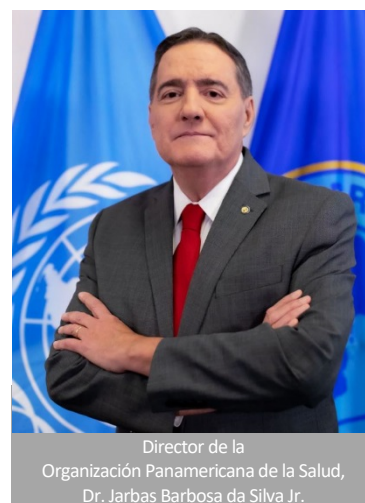
Director de la Organización Panamericana de la Salud, Dr. Jarbas Barbosa da Silva Jr.

El director de la Organización Panamericana de la Salud es el Dr. Jarbas Barbosa da Silva Jr.