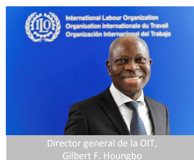
Director general de la OIT, Gilbert F. Hougbo

La fuerza que impulsó la creación de la OIT fue provocada por consideraciones sobre seguridad, humanitarias, políticas y económicas. En 2022 el Consejo de Administración de la OIT ha elegido a Gilbert F. Hougbo como undécimo director general de la Organización; tomó posesión de su cargo el 1.º de octubre. De origen africano, fue presidente del Fondo Internacional de Desarrollo Agrícola (FIDA).