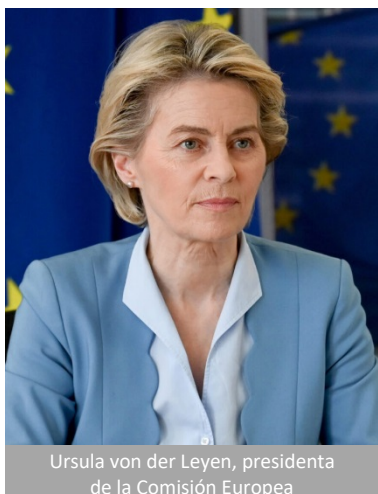
Ursula von der Leyen, presidenta de la Comisión Europea

Cada una de las principales instituciones de la UE tiene su presidente. Roberta Metsola preside el Parlamento Europeo y Ursula von der Leyen preside la Comisión. La presidencia del Consejo Europeo no es un cargo personal; es desempeñada con carácter rotatorio por los países miembros. Cada turno está preestablecido y dura seis meses.