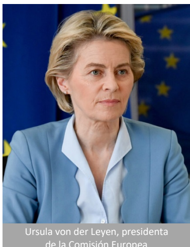
Ursula von der Leyen, presidenta de la Comisión Europea

Cada una de las principales instituciones de la UE tiene su presidente. Roberta Metsola preside el Parlamento Europeo y Ursula von der Leyen preside la Comisión. La presidencia del Consejo Europeo no es un cargo personal; es desempeñada con carácter rotatorio por los países miembros. Cada turno está preestablecido y dura seis meses.