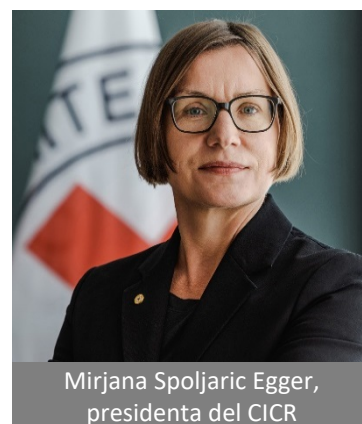
Mirjana Spoljaric Egger, presidenta del CICR

1) “Las consecuencias invisibles de los artefactos explosivos” – Artículo [en línea] / Comité Internacional de la Cruz Roja (CICR), 3 de abril de 2024.