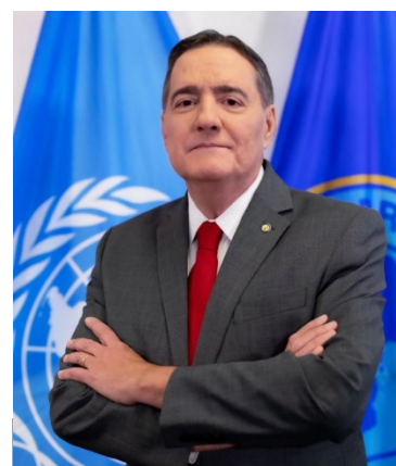
Director de la Organización Panamericana de la Salud, Dr. Jarbas Barbosa da Silva Jr.

El director de la Organización Panamericana de la Salud es el Dr. Jarbas Barbosa da Silva Jr.