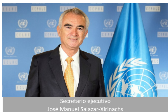
Secretario ejecutivo José Manuel Salazar-Xirinachs

Breve historia. La Comisión Económica para América Latina (CEPAL) fue establecida por la resolución 106 (VI) del Consejo Económico y Social (ONU), del 25 de febrero de 1948, y comenzó a funcionar ese mismo año. Es una de las cinco comisiones regionales de las Naciones Unidas y su sede está en Santiago de Chile.