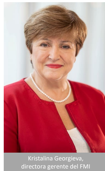
Kristalina Georgieva, directora gerente del FMI

Para más información, véase: https://www.imf.org/en/About .