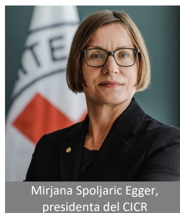
Mirjana Spoljaric Egger, presidenta del CICR

El 1 de octubre de 2022 Mirjana Spoljaric Egger asumió la presidencia del Comité Internacional de la Cruz Roja, sucediendo al presidente saliente Peter Maurer. Estudió filosofía, economía y derecho internacional en la Universidad de Basilea y en la Universidad de Ginebra.