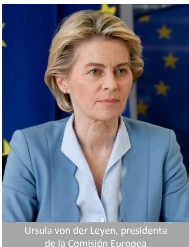
Ursula von der Leyen, presidenta de la Comisión Europea

Cada una de las principales instituciones de la UE tiene su presidente. Roberta Metsola preside el Parlamento Europeo y Ursula von der Leyen preside la Comisión. La presidencia del Consejo Europeo no es un cargo personal; es desempeñada con carácter rotatorio por los países miembros. Cada turno está preestablecido y dura seis meses.