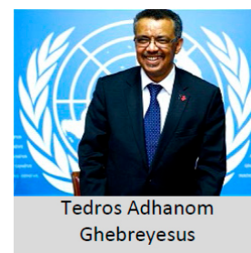
Tedros Adhanom Ghebreyesus

Desde mayo de 2017, el director general es el Dr. Tedros Adhanom Ghebreyesus.