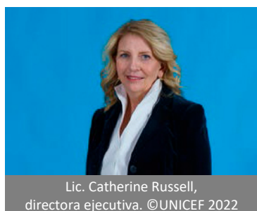
Lic. Catherine Russell, directora ejecutiva.

En 1959 la Asamblea General de las Naciones Unidas aprobó la Declaración de los Derechos del Niño, consagrando los derechos a la educación, la atención de la salud y la nutrición adecuada de los niños. La comunidad internacional ha dotado a UNICEF de autoridad para influir en la toma de decisiones, a fin de plasmar en la realidad las ideas más innovadoras.