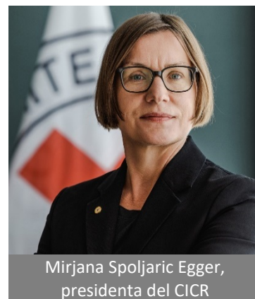
Mirjana Spoljaric Egger, presidenta del CICR

El 1 de octubre de 2022 Mirjana Spoljaric Egger asumió la presidencia del Comité Internacional de la Cruz Roja, sucediendo al presidente saliente Peter Maurer. Estudió filosofía, economía y derecho internacional en la Universidad de Basilea y en la Universidad de Ginebra.