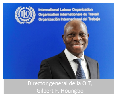
Director general de la OIT, Gilbert F. Hougbo

En 2022 el Consejo de Administración de la OIT ha elegido a Gilbert F. Hougbo como undécimo director general de la Organización; tomó posesión de su cargo el 1.º de octubre. De origen africano, fue presidente del Fondo Internacional de Desarrollo Agrícola (FIDA).