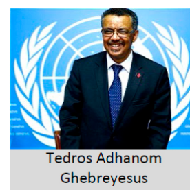
Tedros Adhanom Ghebreyesus

Desde mayo de 2017, el director general es el Dr. Tedros Adhanom Ghebreyesus.