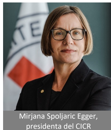
Mirjana Spoljaric Egger, presidenta del CICR

El 1 de octubre de 2022 Mirjana Spoljaric Egger asumió la presidencia del Comité Internacional de la Cruz Roja, sucediendo al presidente saliente Peter Maurer. Estudió filosofía, economía y derecho internacional en la Universidad de Basilea y en la Universidad de Ginebra.