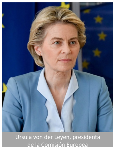
Ursula von der Leyen, presidenta de la Comisión Europea

Cada una de las principales instituciones de la UE tiene su presidente. Roberta Metsola preside el Parlamento Europeo y Ursula von der Leyen preside la Comisión. La presidencia del Consejo Europeo no es un cargo personal; es desempeñada con carácter rotatorio por los países miembros. Cada turno está preestablecido y dura seis meses.