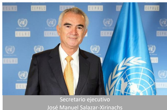
Secretario ejecutivo José Manuel Salazar-Xirinachs

Breve historia. La Comisión Económica para América Latina (CEPAL) fue establecida por la resolución 106 (VI) del Consejo Económico y Social (ONU), del 25 de febrero de 1948, y comenzó a funcionar ese mismo año. Es una de las cinco comisiones regionales de las Naciones Unidas y su sede está en Santiago de Chile.