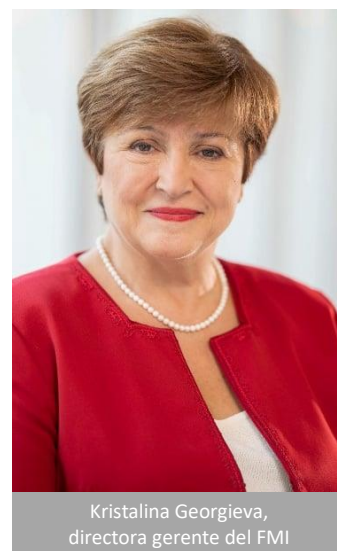
Kristalina Georgieva, directora gerente del FMI

2010 / Una recuperación detenida. A medida que las economías avanzadas luchan por recuperarse, la agitación barre Oriente Medio.