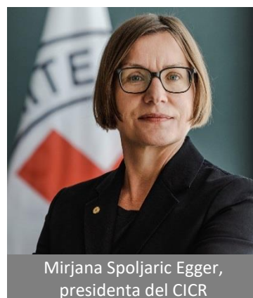
Mirjana Spoljaric Egger, presidenta del CICR

1) “Represa de Nova Kajovka: el CICR facilita el suministro de agua y presta asistencia de salud” – Comunicado de prensa [en línea] / Comité Internacional de la Cruz Roja (CICR), 9 de junio de 2023.