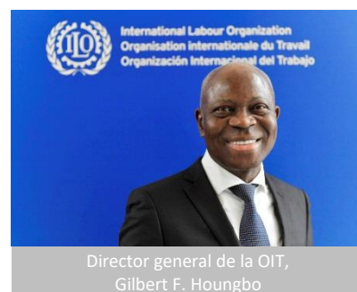
Director general de la OIT, Gilbert F. Hougbo

Declaración de visión - Currículum vitae - Carta de nominación presentada por el Gobierno del Togo .