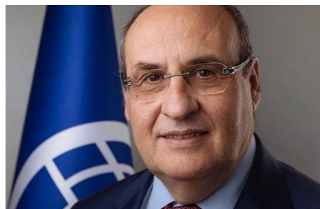
António Vitorino, director general de la Organización Internacional para las Migraciones.

El actual director general de la OIM es el portugués António Vitorino. Ejerce el cargo desde 2018.