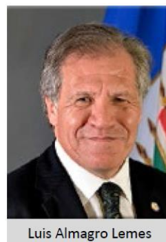
Luis Almagro Lemes

1) “Expertos en derechos humanos llaman a generar información sobre violencia de género contra personas mayores” – Comunicado de prensa N.º 119/23 [en línea] / Comisión Interamericana de Derechos Humanos (CIDH), 14 de junio de 2023.