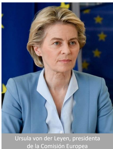
Ursula von der Leyen, presidenta de la Comisión Europea

Cada una de las principales instituciones de la UE tiene su presidente. Roberta Metsola preside el Parlamento Europeo y Ursula von der Leyen preside la Comisión. La presidencia del Consejo Europeo no es un cargo personal; es desempeñada con carácter rotatorio por los países miembros. Cada turno está preestablecido y dura seis meses.