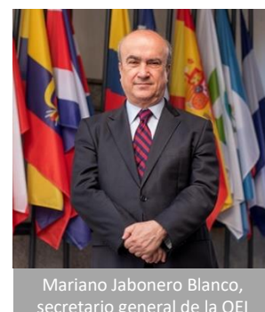
Mariano Jabonero Blanco, secretario general de la OEI

El acuerdo apunta a promover los recursos virtuales de la BCN, que brinda acceso en forma libre y gratuita a contenidos educativos. Se permitirá que esos recursos sean puestos a disposición de toda la región iberoamericana a través de los canales de difusión de todas las oficinas de la OEI, el Portal Panorama y el micrositio a cargo de la Secretaría General. Además, la Biblioteca otorgará a la OEI acceso gratuito e irrestricto a sus cursos, autorizando su difusión y publicación.