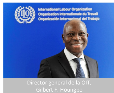
Director general de la OIT, Gilbert F. Houngbo

Declaración de visión - Currículum vitae - Carta de nominación presentada por el Gobierno del Togo