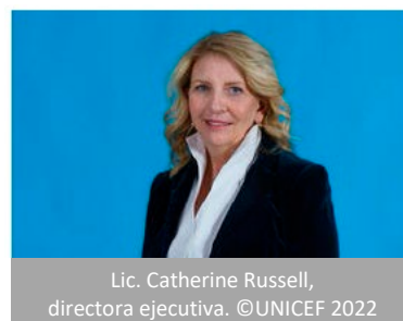
Lic. Catherine Russell, directora ejecutiva.