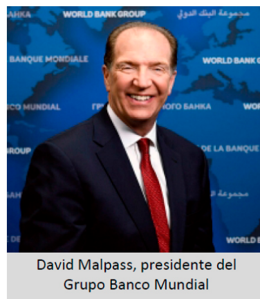
David Malpass, presidente del Grupo Banco Mundial

Proporciona una gran variedad de productos financieros y asistencia técnica, y ayuda a los países a enfrentar los desafíos mediante el intercambio de conocimiento de vanguardia y la aplicación de soluciones innovadoras. David R. Malpass es el presidente del Grupo Banco Mundial; asumió su cargo el 9 de abril de 2019. Para más información véase: https://www.bancomundial.org/ .