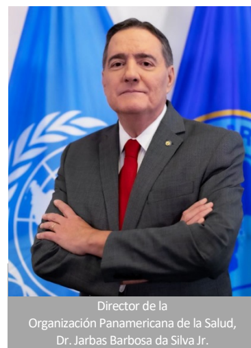
Director de la Organización Panamericana de la Salud, Dr. Jarbas Barbosa da Silva Jr.

El director de la Organización Panamericana de la Salud es el Dr. Jarbas Barbosa da Silva Jr.