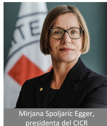
Mirjana Spoljaric Egger, presidenta del CICR