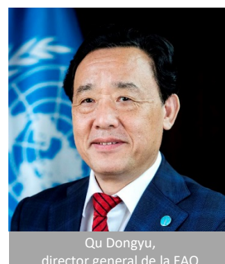
Qu Dongyu, director general de la FAO

Para más información véase: http://www.fao.org/about/es/ .