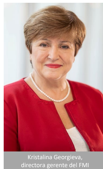
Kristalina Georgieva, directora gerente del FMI

Respuesta al coronavirus: prevalecen los aportes monetarios para aliviar las economías de los países menos desarrollados.