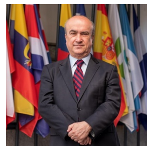
Mariano Jabonero Blanco, secretario general de la OEI

El acuerdo apunta a promover los recursos virtuales de la BCN, que brinda acceso en forma libre y gratuita a contenidos educativos. Se permitirá que esos recursos sean puestos a disposición de toda la región iberoamericana a través de los canales de difusión de todas las oficinas de la OEI, el Portal Panorama y el micrositio a cargo de la Secretaría General. Además, la Biblioteca otorgará a la OEI acceso gratuito e irrestricto a sus cursos, autorizando su difusión y publicación.