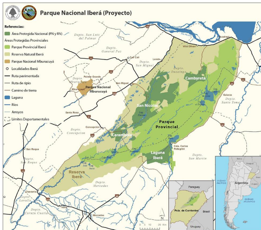
Mapa N° 1: Parque Iberá - Portales del PN Iberá en verde oscuro.

El Plan de Reapertura del PNIB, contempla 2 (dos) fases. El desarrollo de la FASE I permitirá ir retomando las actividades de manera gradual lo cual, con el correspondiente monitoreo y la anuencia de las autoridades locales, provinciales y nacionales correspondientes, se dará paso a la FASE II con una ampliación de actividades y servicios turísticos. Por el momento, y hasta ver la evolución de la situación epidemiológica a nivel provincial, se implementará únicamente la FASE I del PLAN DE REAPERTURA POR FASES DEL PARQUE NACIONAL IBERÁ.