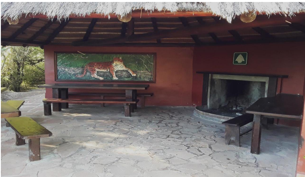
Foto N° 1: Portal Laguna Iberá – Quincho “Matera”, lugar de registro obligatorio antes de recorrer senderos.