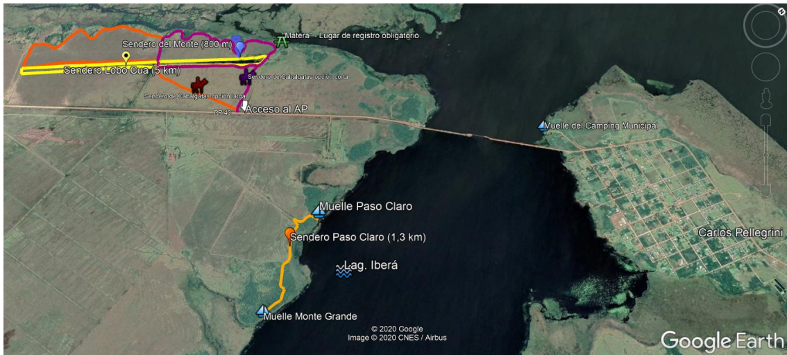
Mapa N° 4: Portal Laguna Iberá – Área de uso público intensivo.