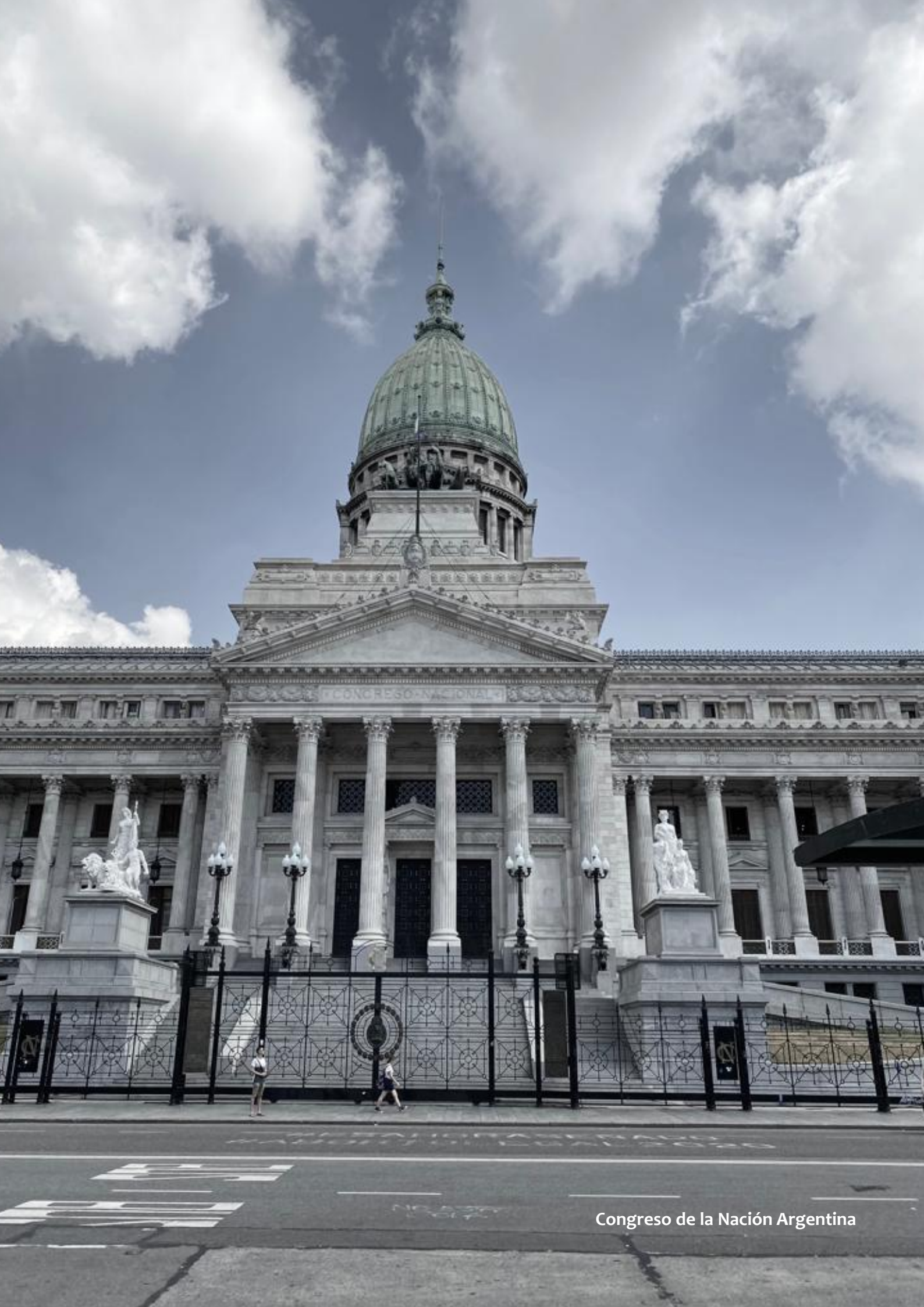
Congreso de la Nación Argentina