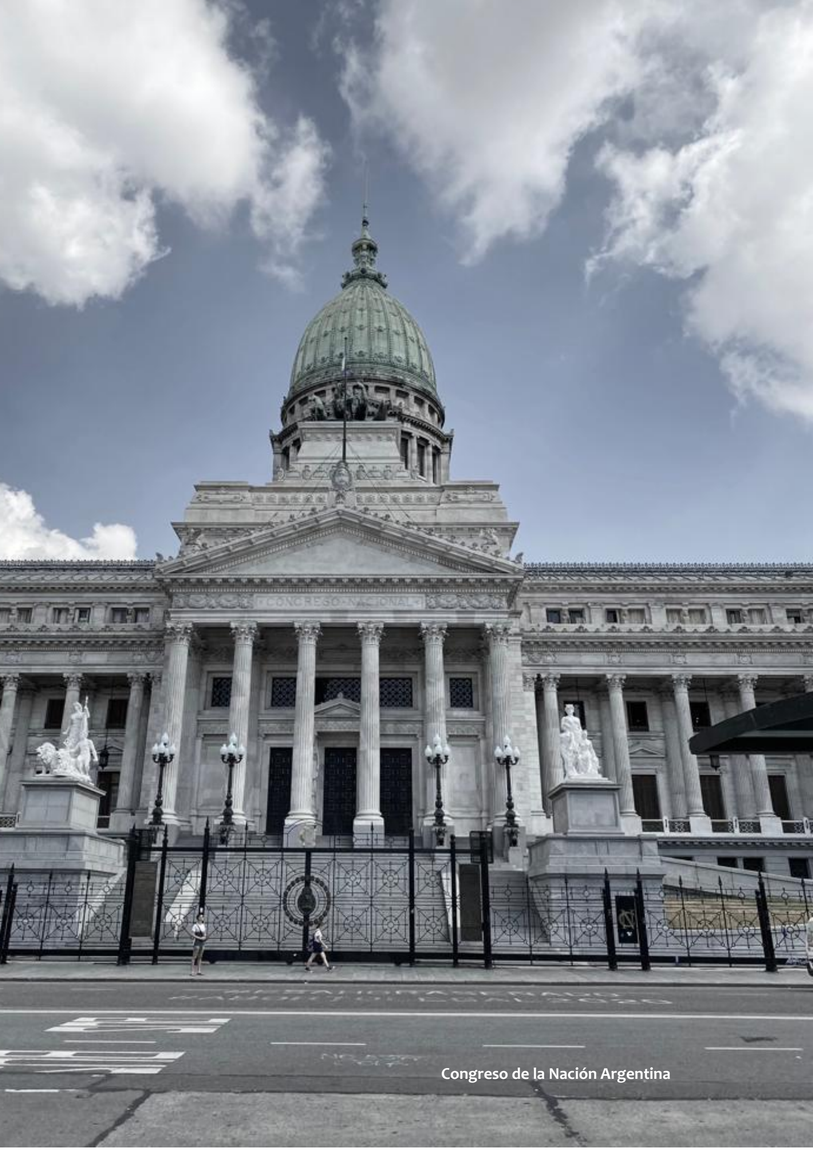
Congreso de la Nación Argentina