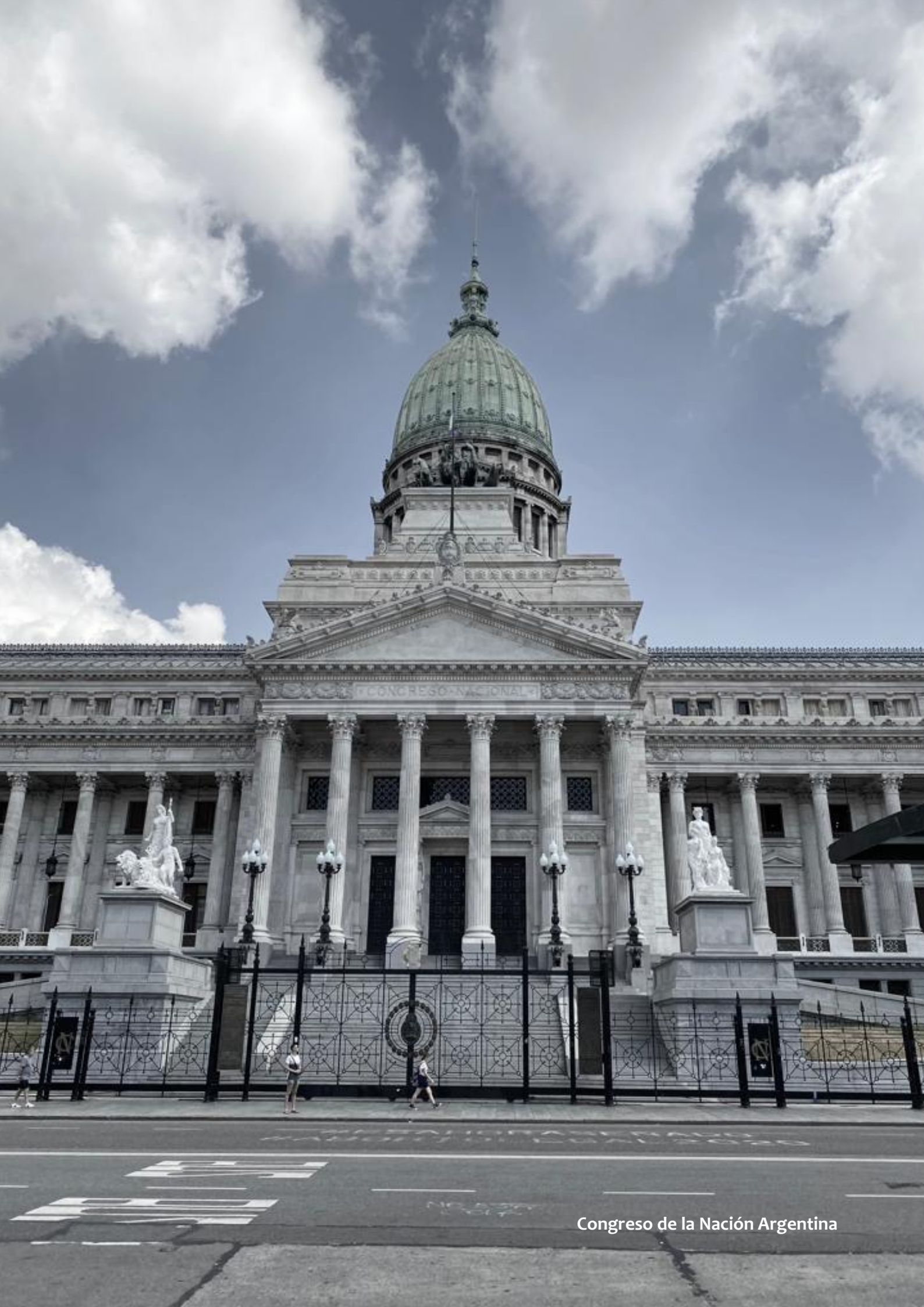
Congreso de la Nación Argentina