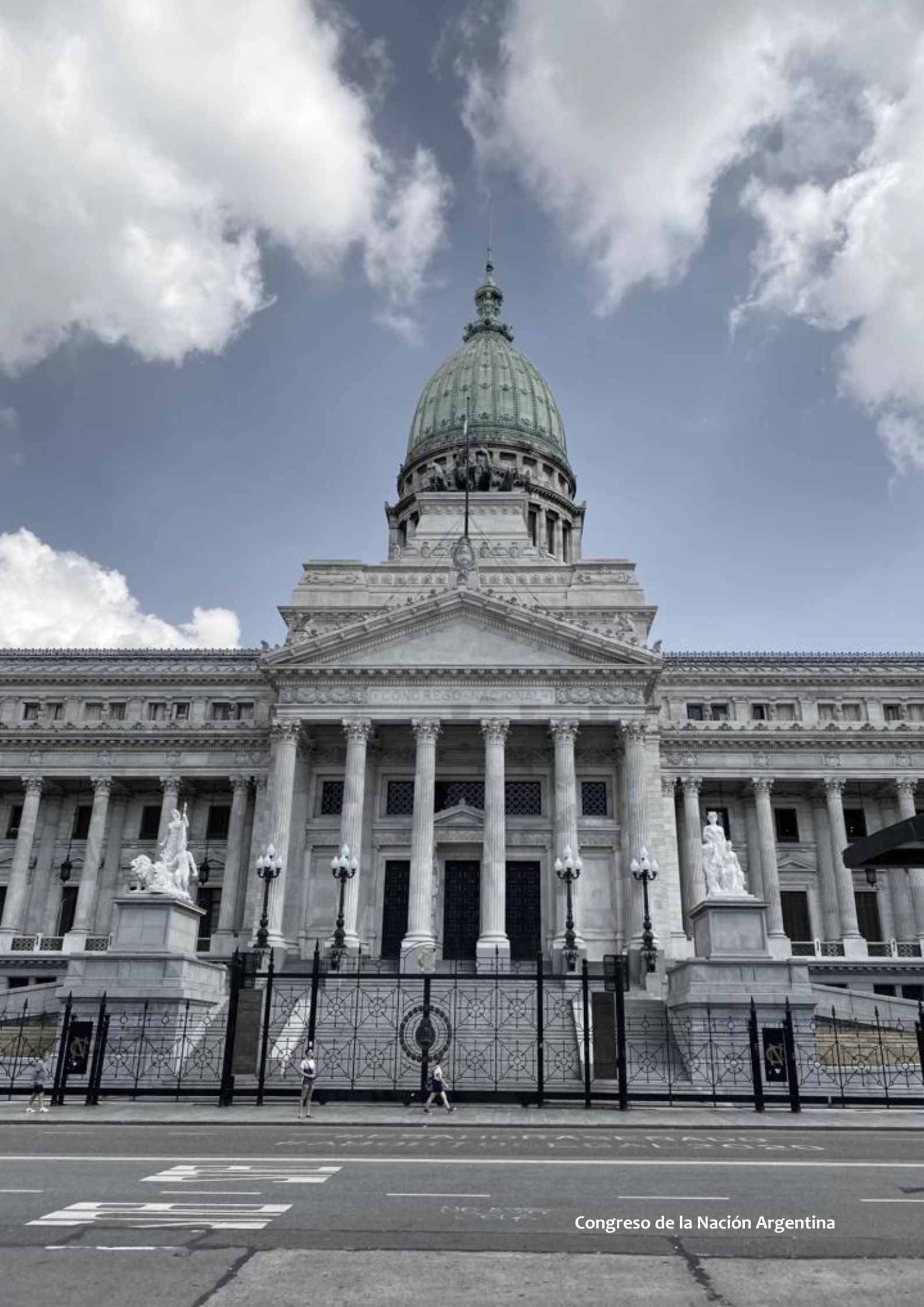
Congreso de la Nación Argentina