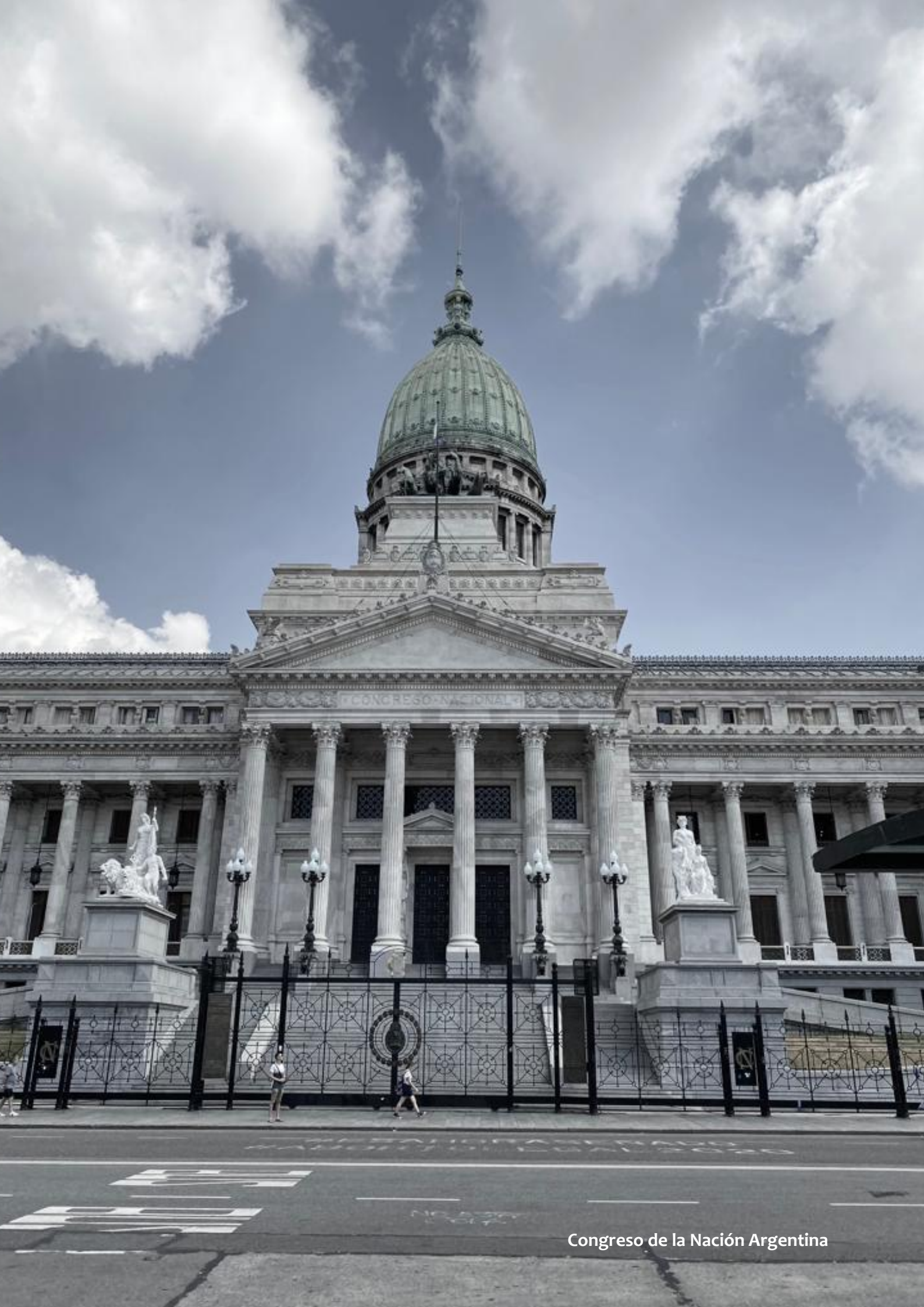
Congreso de la Nación Argentina