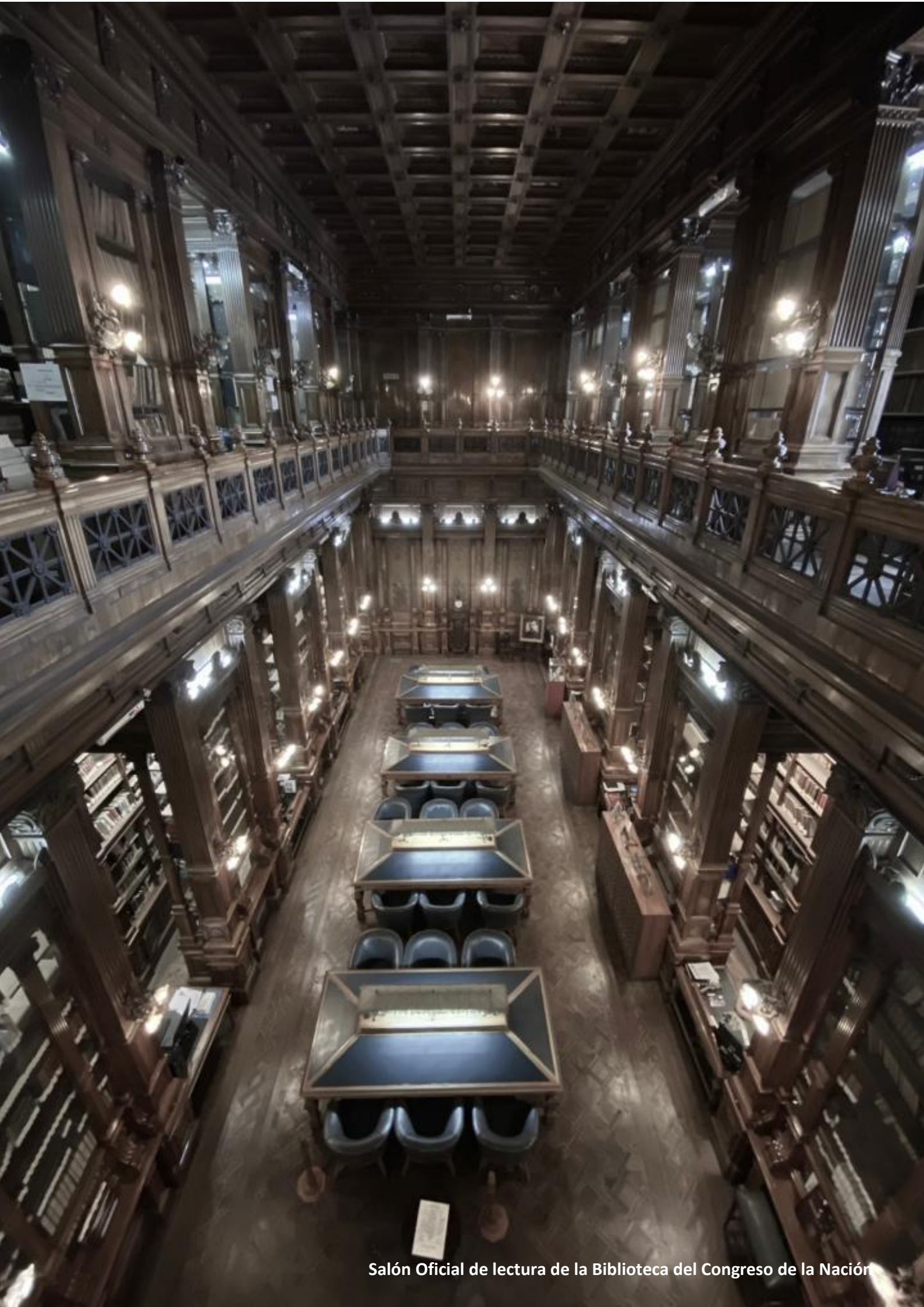
Salón Oficial de lectura de la Biblioteca del Congreso de la Nación